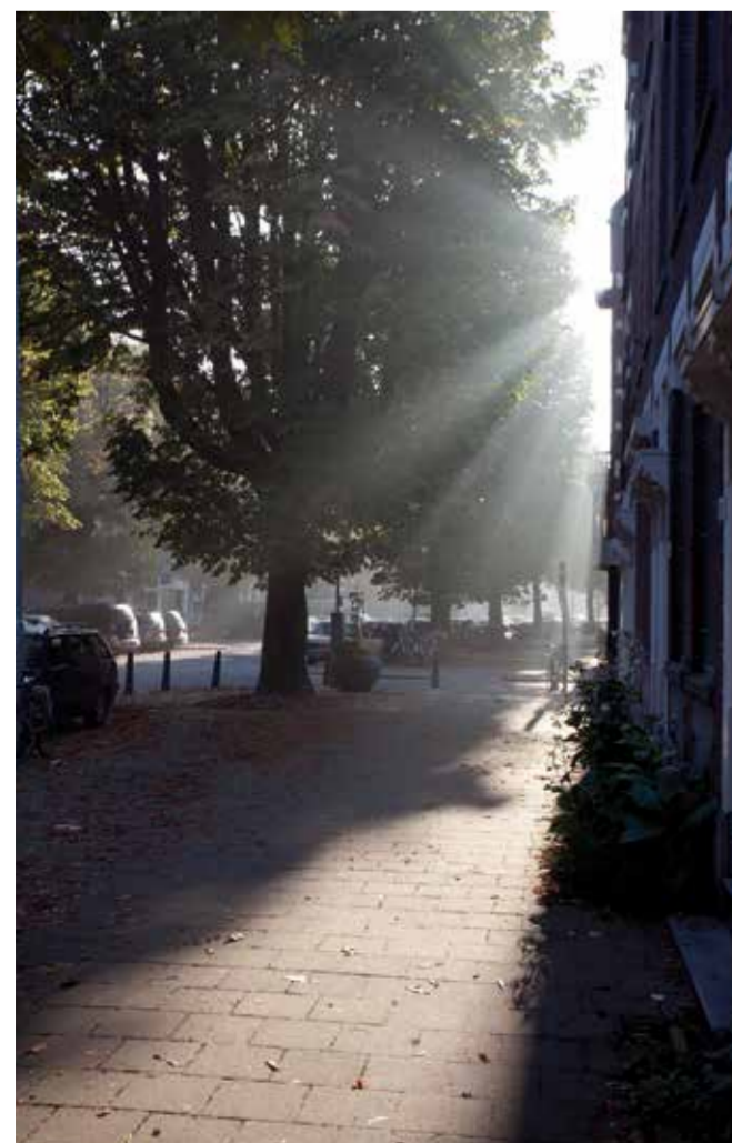
Ochtendlicht burgemeester Meineszlaan